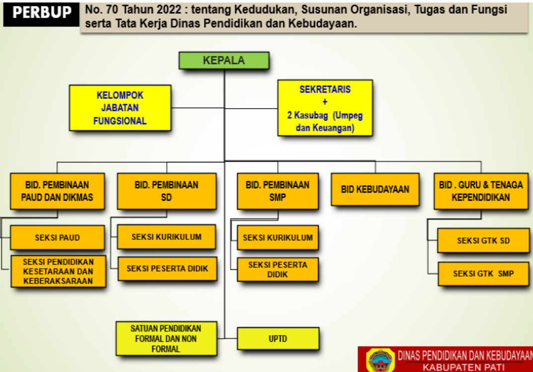
Gambar 1.2 Struktur Organisasi Dinas Pendidikan dan Kebudayaan Kabupaten Pati

Dinas Pendidikan dan Kebudayaan Kabupaten Pati dalam mencapai tujuan sasaran organisasi telah diamanatkan tugas dan fungsi organisasi yang tercantum dalam Peraturan Bupati Pati Nomor 70 Tahun 2022. Berikut struktur organisasi Dinas Pendidikan dan Kebudayaan Kabupaten Pati: