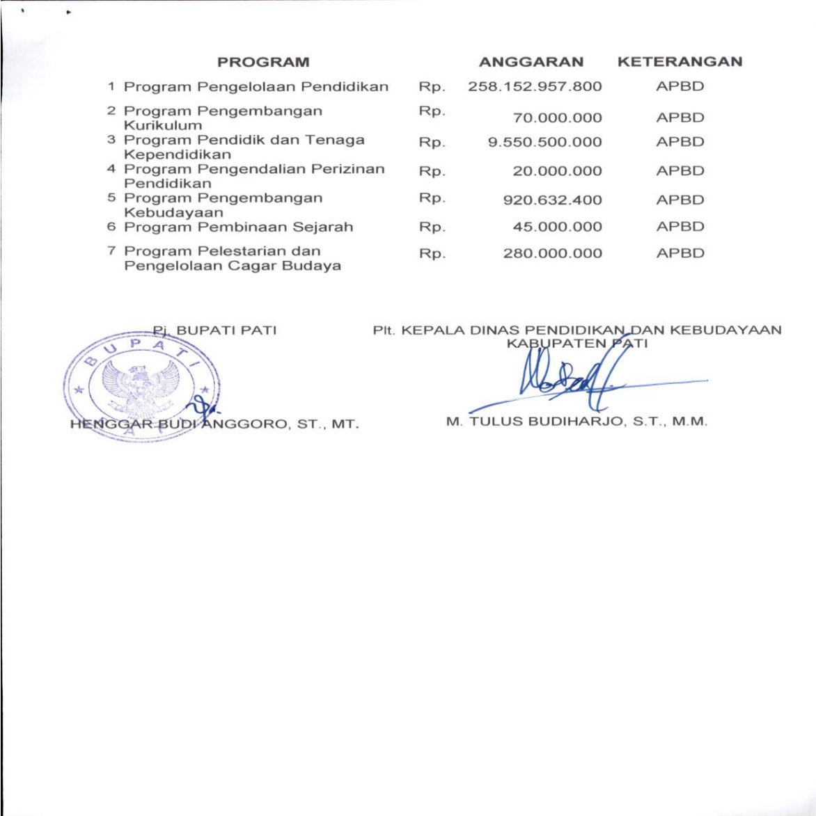
Gambar 2.3 Perjanjian Kinerja 2024 Kepala Dinas Pendidikan dan Kebudayaan Kab. Pati

Apabila dicermati, antara RKT dengan PK, maka target kinerjanya sudah sama.